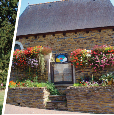
Ancienne Maison des Arts