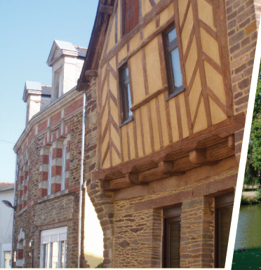
Maison à pans de bois