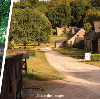
Village des forges