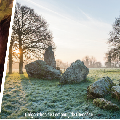
Mégalithes de Lampouy de Médréac.