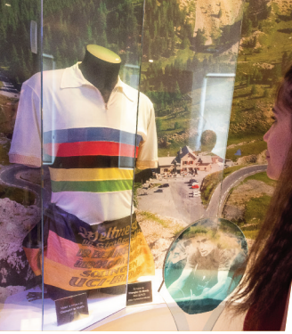
Espace Tous à vélo avec Louison Bobet.