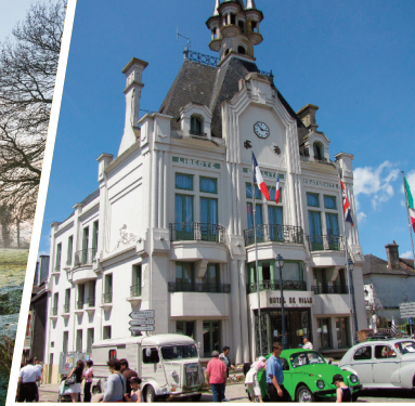
Mairie de Saint-Méen-le-Grand.