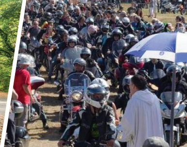
La Madone des motards