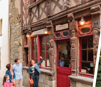
Ploërmel, rue Beaumanoir