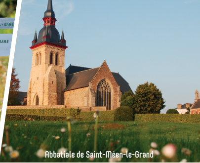
Abbatiale de Saint-Méen-le-Grand