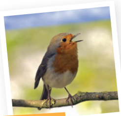
Le rouge gorge

À présent, propriété de la commune de Saint-Nicolas-du-Tertre, le Bois de Grisan est un site riche d'une faune et d'une flore très diversifiées. Il saura ravir les grands comme petits promeneurs, curieux de découvrir au travers de 61 panneaux pédagogiques, les animaux, les plantes et l'écosystème de cet espace naturel.