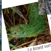
Le lézard vert