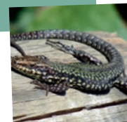
Le lézard des murailles