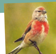
La linotte mélodieuse