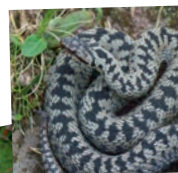
La vipère péliade