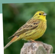
Le bruant jaune

De nombreuses espèces animales trouvent refuge entre les branches tortueuses des fourrés et les épines. Des oiseaux comme l'engoulevent d'Europe, le bruant jaune, la linotte mélodieuse, mais aussi des reptiles, comme le lézard vert, la vipère péliade, le lézard des murailles.